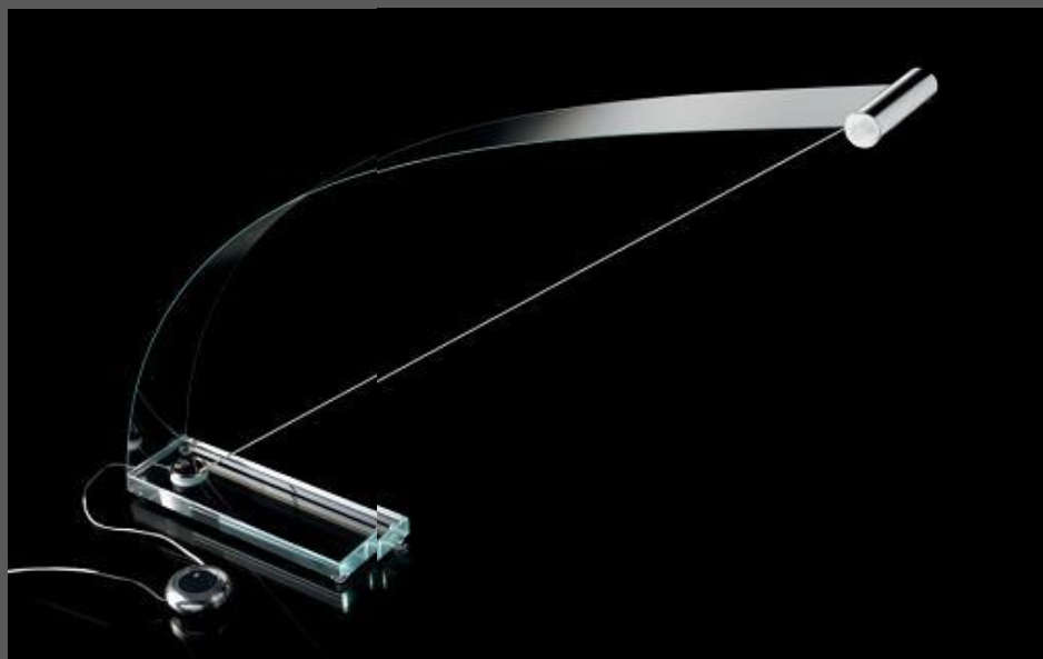
Lampada a Led mod. Flex Azienda Reflex